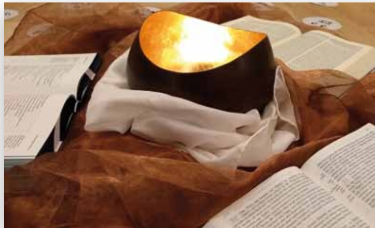
Gestaltete Mitte, Bibelkurs 2017