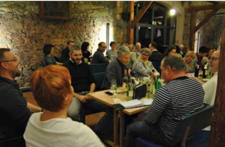
Gemütliches Beisammensein und Tagesausklang in der „Scheune“