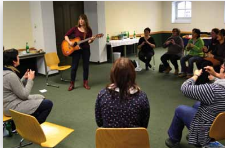
Weiterbildung „Kinderlied“ für Erzieher/-innen, 1. Oberlausitzer Kinderliederfestival 2017