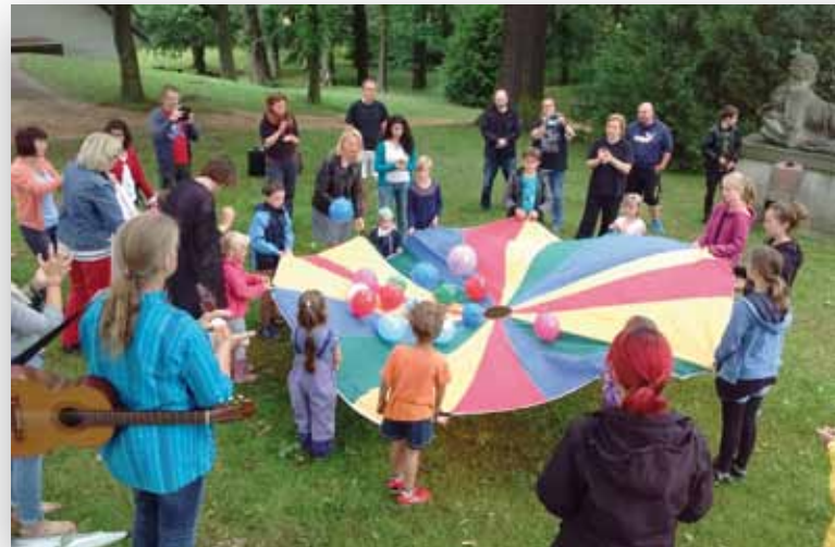
Lieder und -tänze, Familienbildungswoche 2017