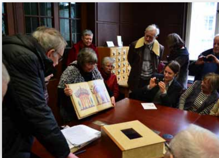
Exkursion, Winterakademie 2017