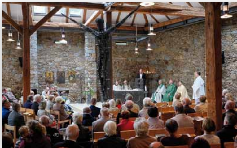
Festgottesdienst zum 25-jährigen Jubiläum des Bischof-Benno-Hauses 2017